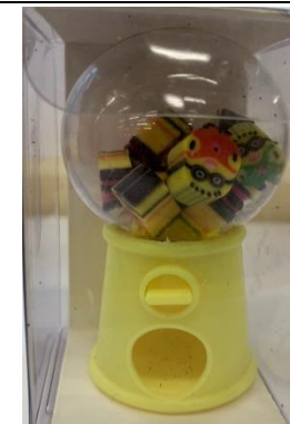
5. 小型扭蛋機(內附橡皮膠)